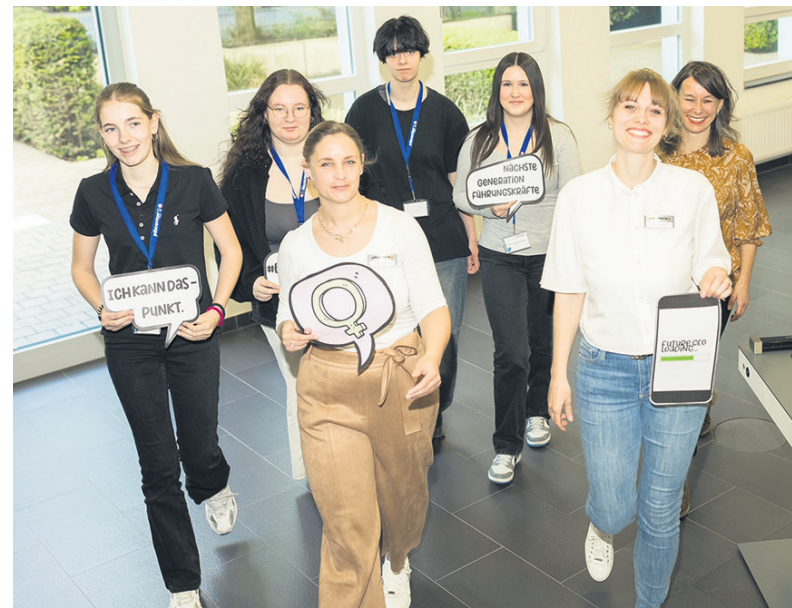
Girls' Day im jobcenter Duisburg

Bei weitergehenden Fragen wenden Sie sich gerne an Jasmin Borgstedt oder Luisa Postfeld unter jobcenter-duisburg.bca@jobcenter-ge.de