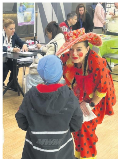
Das bunte Unterhaltungsprogramm kam auch bei den kleinen Gästen gut an

Abgerundet wurde die Veranstaltung durch ein buntes Mitmach-Programm für Kinder.